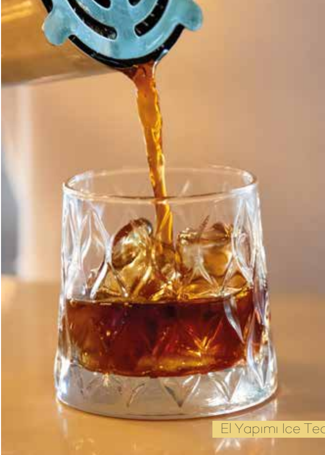
El Yapımı Ice Tea