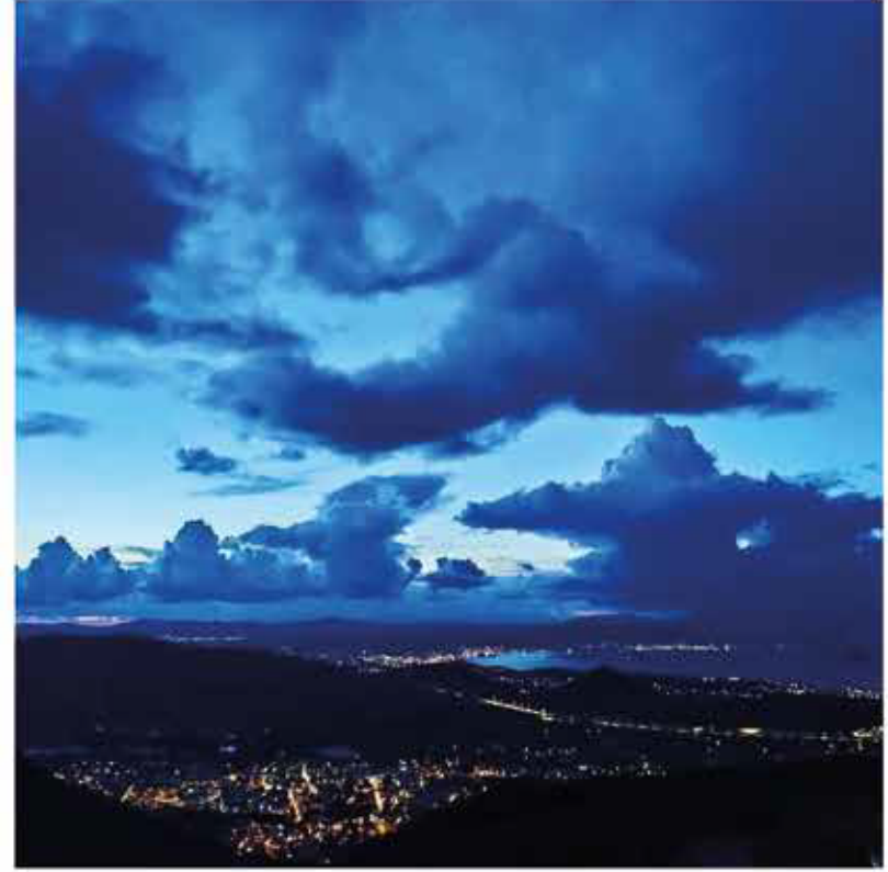
Proje alanından gece manzarası