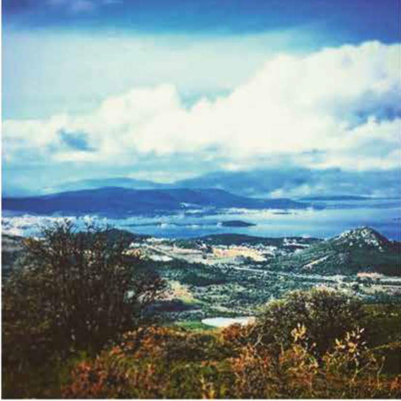
Proje alanından manzara